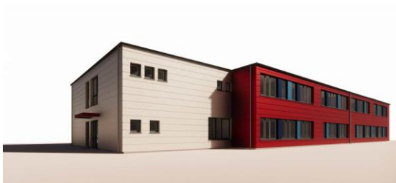
Neubau des Fachklassentraktes

Im Oktober wurde der Baugrund für die Aufstellung der einzelnen Module vorbereitet. Im Dezember wurde die Bodenplatte mit Beton ausgegossen. Weiterhin ist die Errichtung des Gebäudes in Modulweise im Januar geplant und die Fertigstellung für den Sommer 2023. Wir stehen in allen Bauphasen im engen Kontakt mit der Stadt Rendsburg und sind bestrebt, Störungen des Schulalltags mit schulorganisatorischen Maßnahmen bestmöglich zu vermeiden.