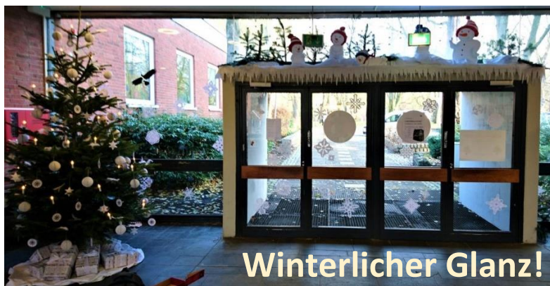
Winterzauber in der Herderschule