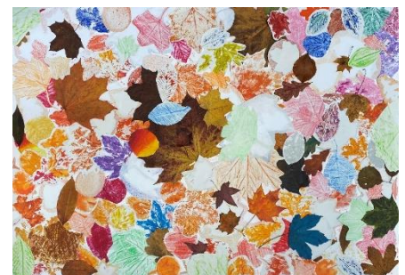
„Herbst-Druck“ – Gruppenarbeit der Klasse 6a

Herderschule.Rendsburg@schule.la ndsh.de