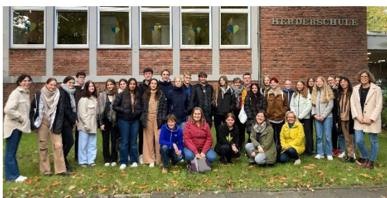
TeilnehmerInnen der Europawoche

In der Woche vom 01. Oktober bis 08. Oktober 2022 fuhren einige unserer Schülerinnen und Schüler der Herderschule im Rahmen des Erasmus-Projekts in unsere Partnerländer nach Finnland, Italien, Ungarn und Polen. Wir begrüßten in Rendsburg ebenso die vier Delegationen, auf die ein interessantes und abwechslungsreiches Programm mit ihren deutschen Gastgebern wartete. Am Ende dieser gemeinsamen Woche fiel der Abschied voneinander schwer! Ein großer Dank geht an alle, die dieses Projekt tatkräftig unterstützt haben.