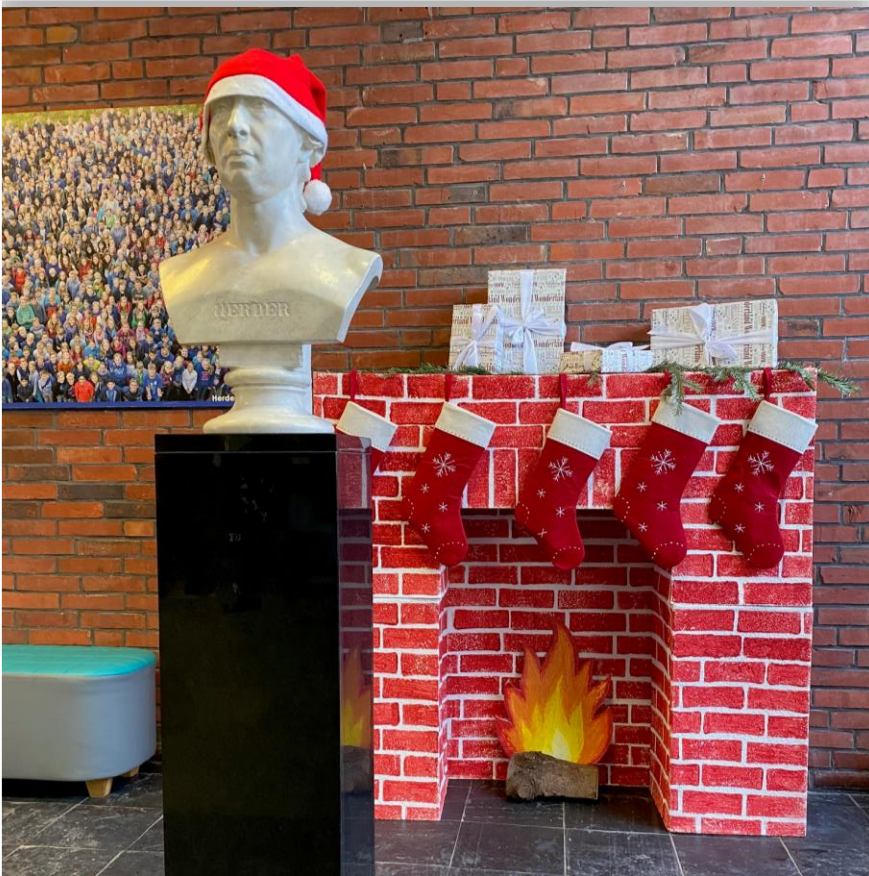
Herders Weihnacht

EUROPASCHULE GYMNASIUM DER STADT RENDSBURG